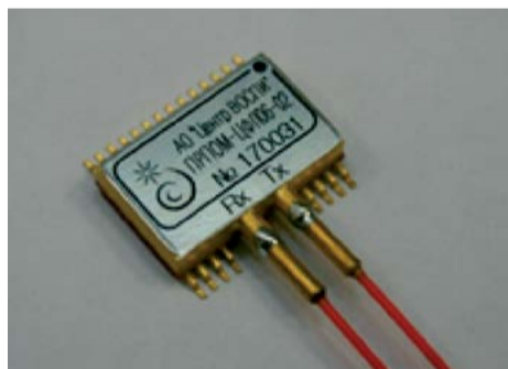
Фото модуля в сборке

Пожелаем им новых творческих успехов, инновационных решений, реализация которых будет служить решению важнейших задач, как личных, так и для предприятия, и страны в целом!